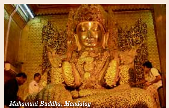
Mahamuni Buddha, Mandalay