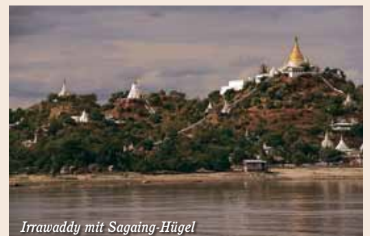
Irrawaddy mit Sagaing-Hügel