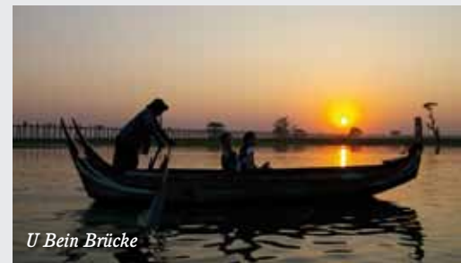
U Bein Brücke