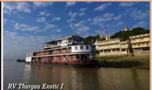
RV Thurgau Exotic I