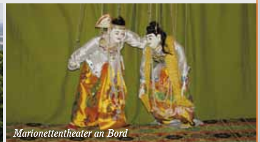
Marionettentheater an Bord