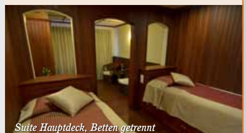
Suite Hauptdeck, Betten getrennt