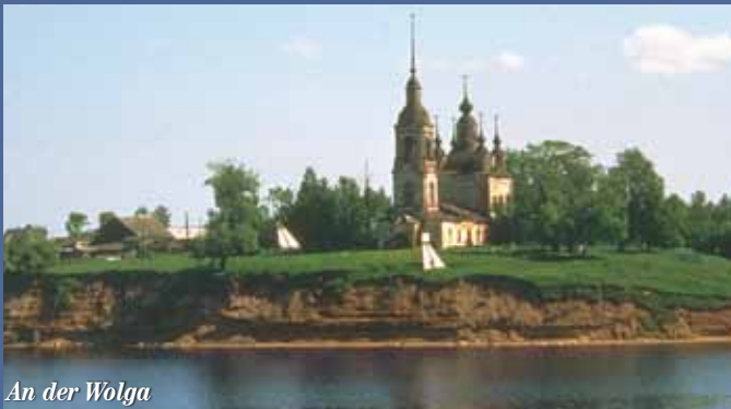
An der Wolga